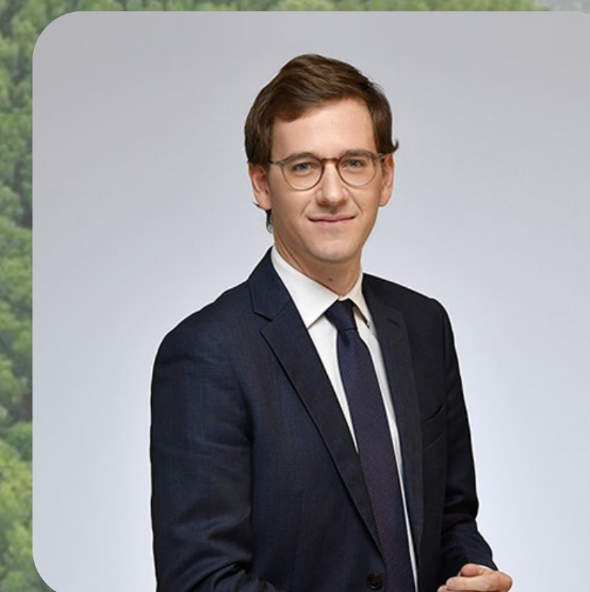
Marin du Repaire

Avocat Collaborateur mhubier@yards-avocats.com